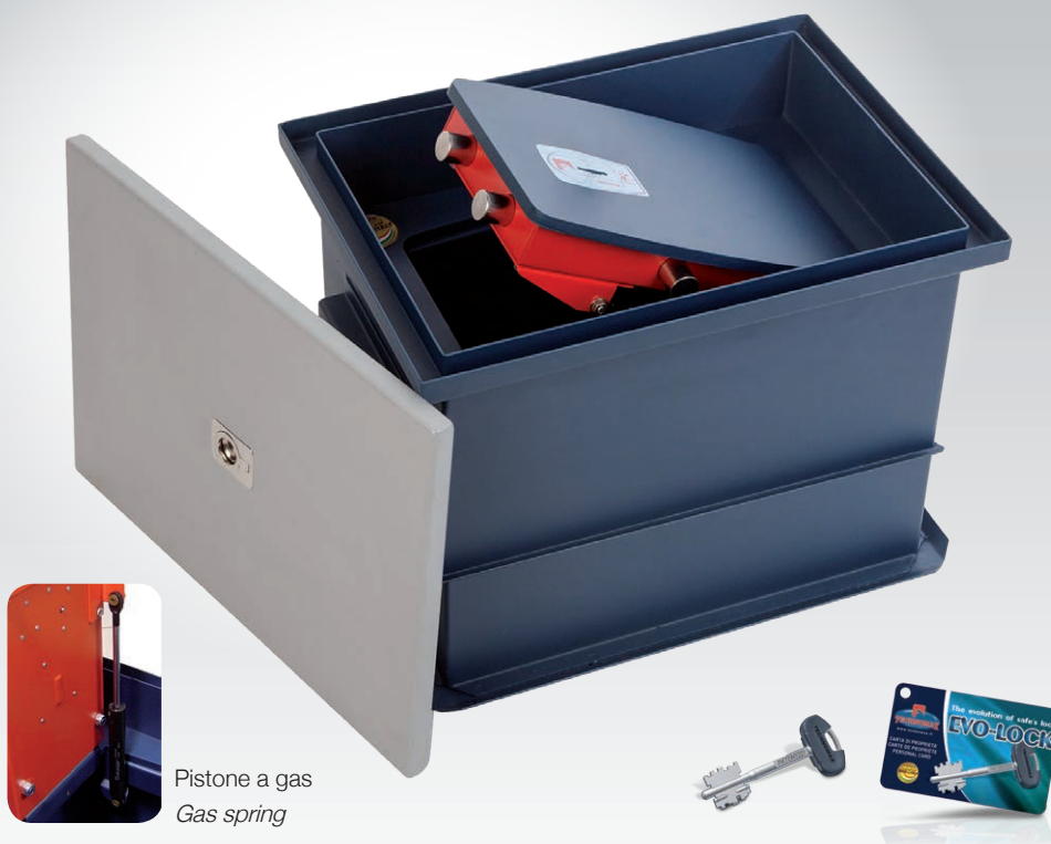
Pistone a gas Gas spring